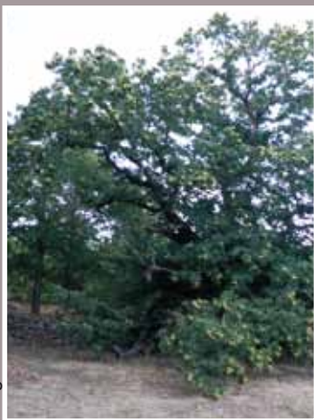
CASTAÑO ( Castanea sativa )