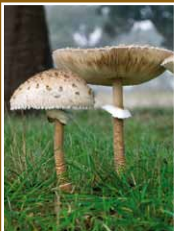
PARASOL ( Macrolepiota procera )