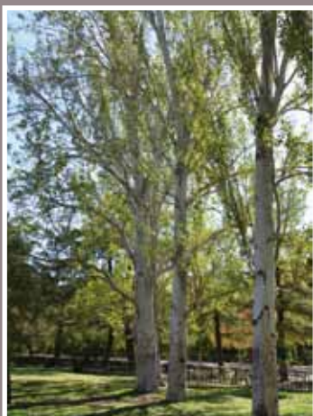
ÁLAMO BLANCO ( Populus alba )